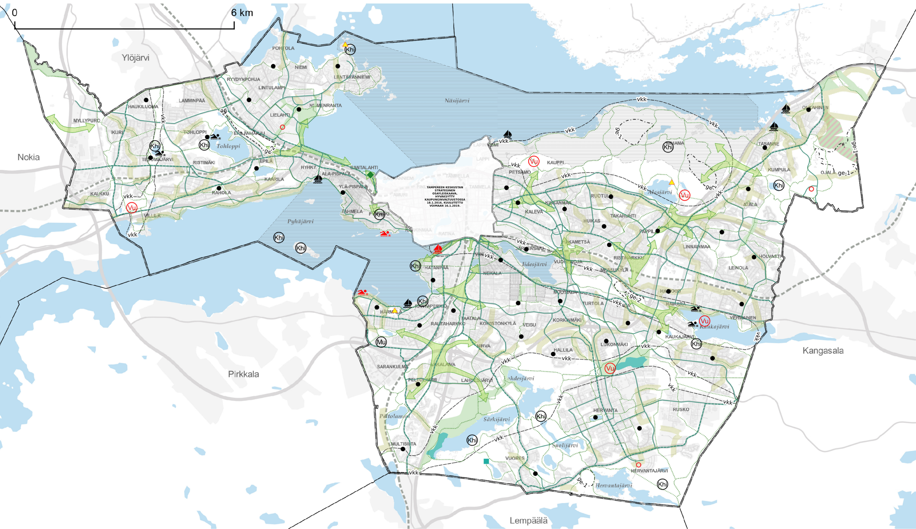
KARTTA 2 - VIHERYMPÄRISTÖ JA VAPAA-AJAN PALVELUT